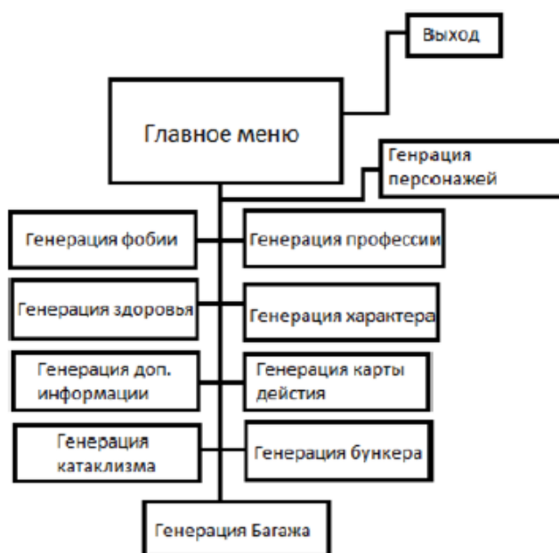
Рисунок 2 – Структурная схема программного модуля

Все иллюстрации в пояснительной записке называются рисунками. Нумерация рисунков в пределах всей пояснительной записки должна быть сквозной. В работе допускаются цветные рисунки. Название рисунка состоит из его номера и наименования, в номер рисунка включается слово «Рисунок», отделенное знаком «пробел» и тире от цифрового обозначения. На все рисунки в тексте работы должны быть ссылки.