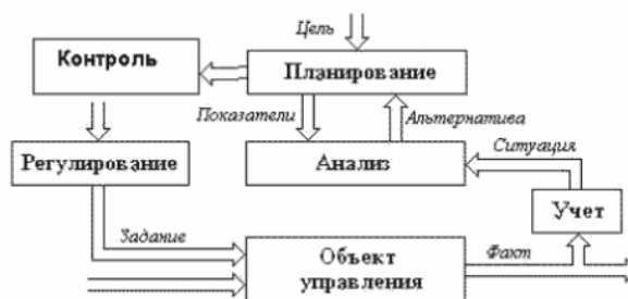
Рисунок 2 – Технология процесса управления

Нумерация листов пояснительной записки должна быть сквозной для текста и приложений, начиная с титульного листа. Проставляется нумерация с третьего листа (титульный лист и задание не нумеруются). Номер листа проставляется справа внизу.