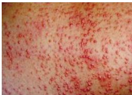
Рисунок 2 – Высыпания на коже, везикулопупулез