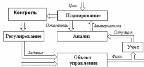
Рисунок 2 – Технология процесса управления

Нумерация листов пояснительной записки должна быть сквозной для текста и приложений, начиная с титульного листа. Проставляется нумерация с третьего листа (титульный лист и задание не нумеруются). Номер листа проставляется справа внизу.